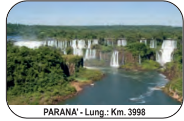
PARANA - Lung.: Km. 3998