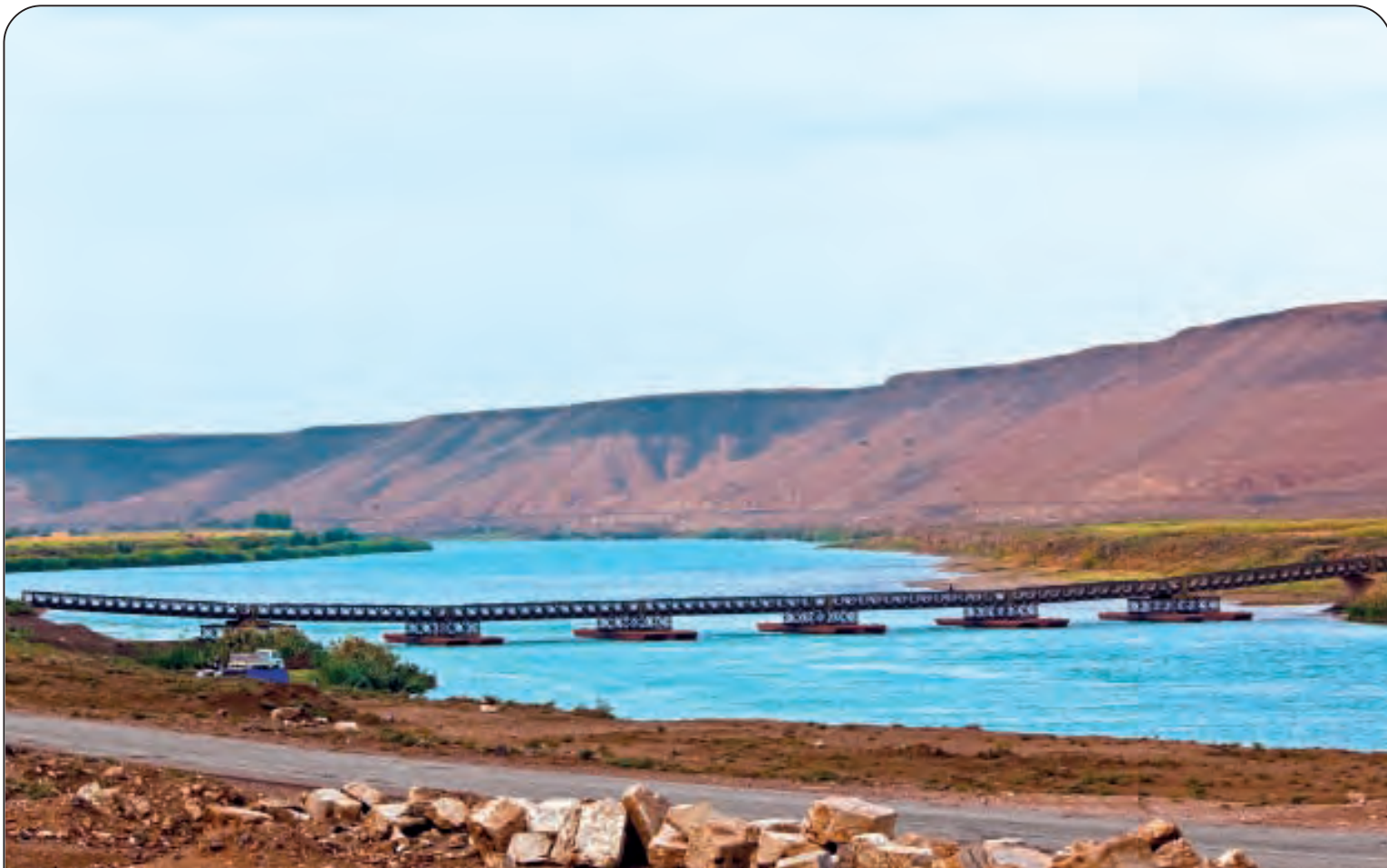
EUFRATE - Lunghezza: Km. 2760 - Nasce sul monte Ararat (Armenia turca) e sfocia nel Golfo Persico (Oceano Indiano) Nel mondo: 29° per lunghezza - Paesi attraversati: Turchia, Siria, Iraq