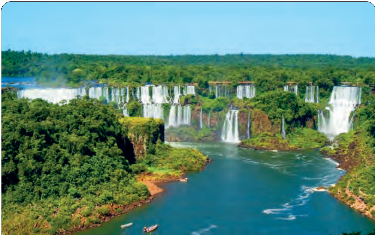
PARANA' - RIO DELLA PLATA - Lunghezza: Km. 3998 - Nasce dalla confluenza del Rio Paranaiba e Rio Grande (Altopiani del Brasile) e sfocia nell'Oceano Atlantico Nel mondo: 13° per lunghezza - Paesi attraversati: Brasile, Bolivia, Uruguay, Paraguay, Argentina