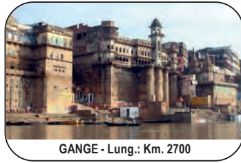
GANGE - Lung.: Km. 2700