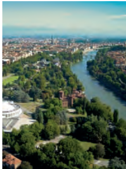
Il Po a Torino col Parco del Valentino, il Borgo Medioevale ed, in fondo, la Mole Antonelliana

l'egizio Nilo, il mesopotamico Eufrate ed il Po, piccolo italico fiume, ricco di una storia densa e continuativa di almeno 3000 anni. Per i Greci il lungo corso d'acqua era l' Eridanos , indicazione di fiume mitico (Rhdhn), simile a Rodano, Reno e Danubio. I Romani replicarono Eridanus , ma poi adottarono il nome Padus derivato, pare, dal ligure Bodinkos (se non dal greco Potamos , fiume per antonomasia). Da Padus , Paus , volgarizzato in Po(s) . Dal secolo X a.C. e per mezzo millennio il Fiume fu la linea di collegamento, e insieme di separazione, dei popoli che confluivano verso la Pianura formata dal Po (che non fu Pianura d'Italia prima del secolo I a.C.): Celti, Liguri, poi Etruschi e viaggiatori e mercanti preellenici. Il corso d'acqua era navigabile fino alla confluenza con la Dora Riparia (Torino), come affermano Plinio il Vecchio, Polibio e Strabone e ciò favorì i traffici ed il precoce sviluppo dei