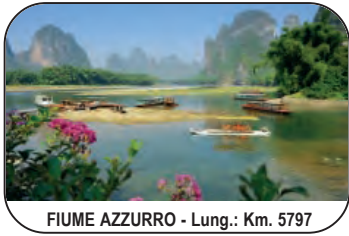
FIUME AZZURRO - Lung.: Km. 5797