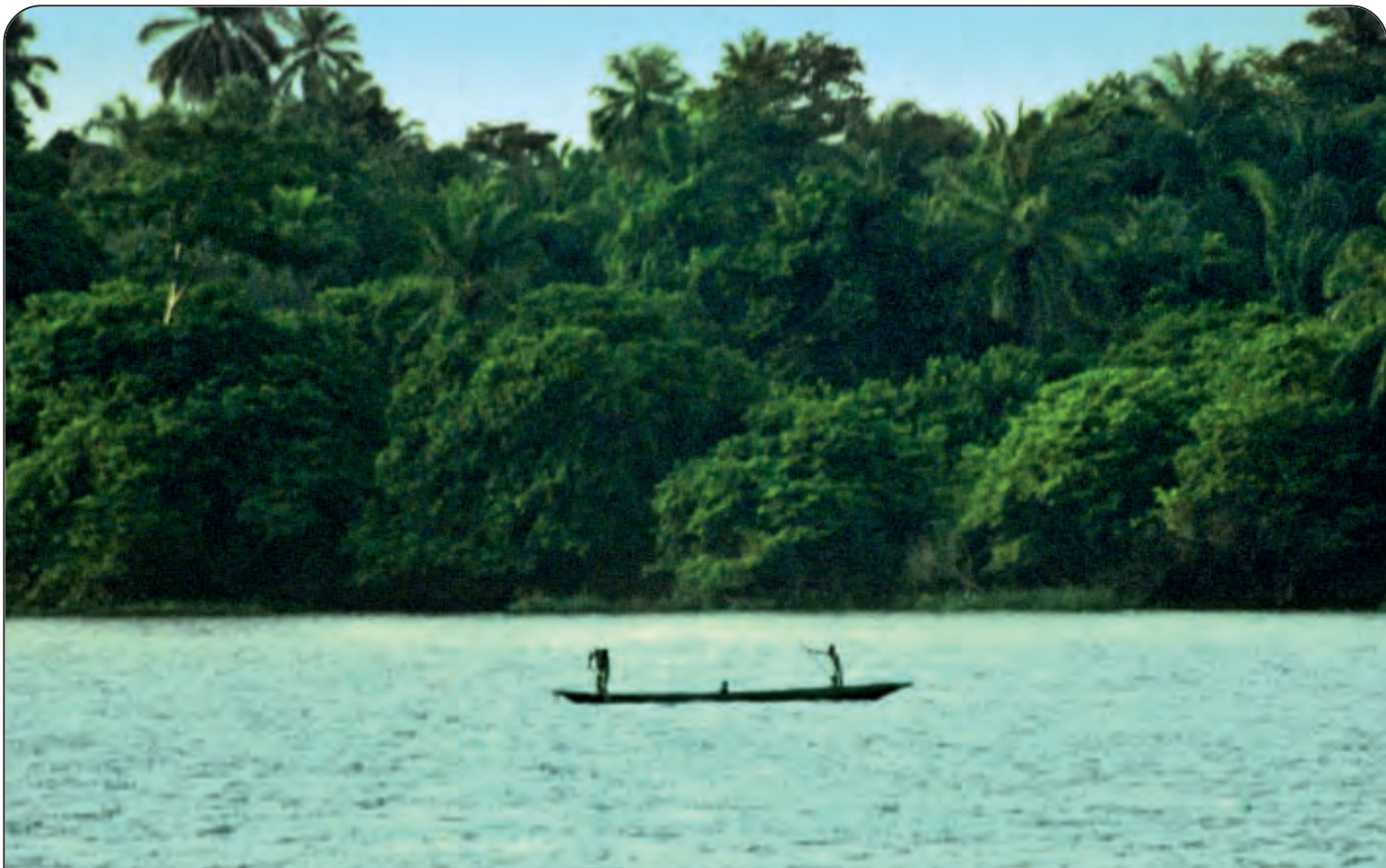
CONGO - Lunghezza: Km. 4371 - Nasce sul monte Musofi (Congo - Zambia) e sfocia nell'Oceano Atlantico Nel mondo: 10° per lunghezza - Paesi attraversati: Rep. Dem. del Congo, Rep. del Congo, Angola