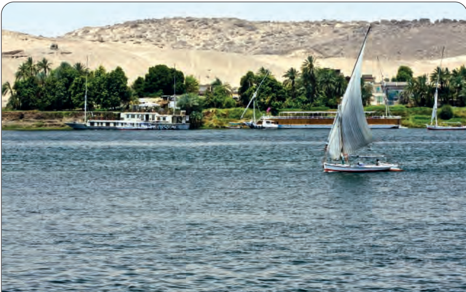
NILO - Lunghezza: Km. 6695 - Nasce dal Monte Giziki (Burundi) e sfocia nel Mar Mediterraneo Nel mondo: 2° per lunghezza - Paesi attraversati: Burundi, Ruanda, Tanzania, Uganda, Sudan, Egitto