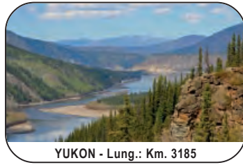
YUKON - Lung.: Km. 3185