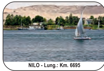
NILO - Lung.: Km. 6695