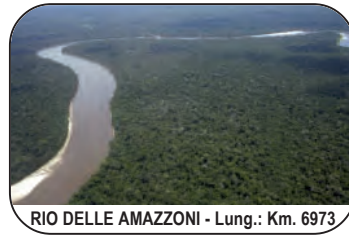
RIO DELLE AMAZZONI - Lung.: Km. 6973