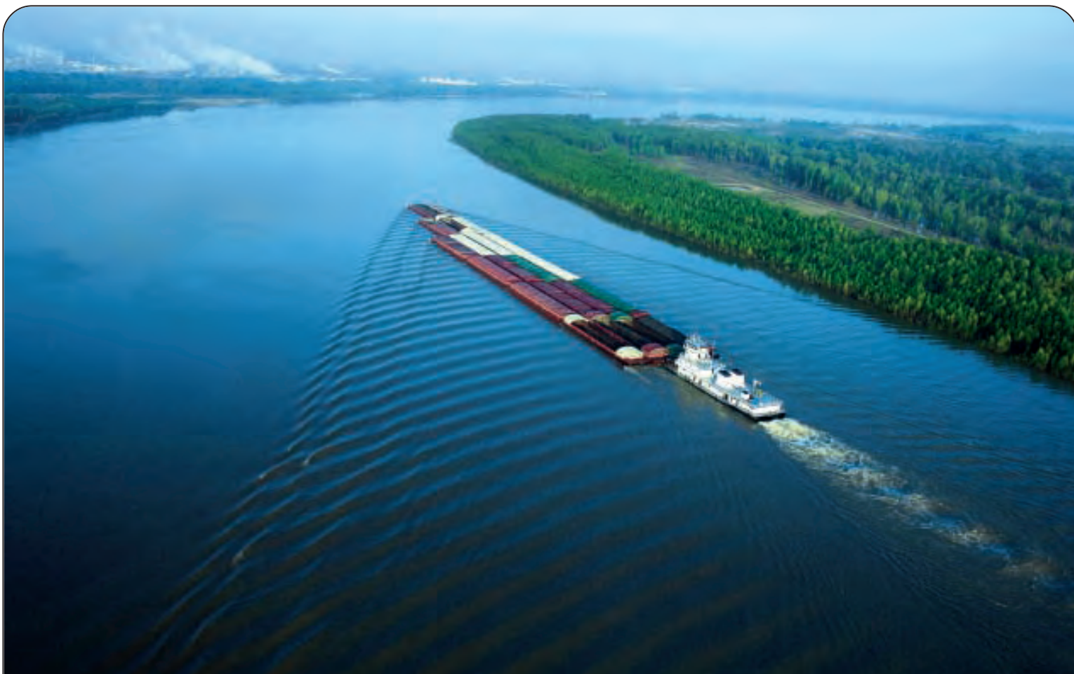
MISSISSIPPI - Lunghezza: Km. 5970 - Nasce dal lago Itasca (Minnesota) e sfocia nel Golfo del Messico Nel mondo: 3° per lunghezza - Paesi attraversati: Minnesota, Wisconsin, Iowa, Illinois, Missouri, Kentucky, Arkansas, Tennessee, Mississippi, Louisiana