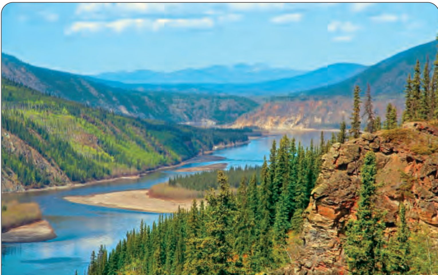
YUKON - Lunghezza: Km. 3185 - Nasce dal lago Atlin (Canada - Territorio dello Yukon) e sfocia nel Mare di Bering (Oceano Pacifico) Nel mondo: 19° per lunghezza - Paesi attraversati: Canada