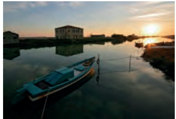
Delta del Po

I fiumi sono la risorsa più importante del Pianeta e della vita che esso ospita, perché costituiscono riserve d'acqua indispensabile per l'alimentazione umana e delle specie che in essi vivono (pesci, anfibi, insetti), che a loro volta sono risorse per molte specie animali, volatili e terricoli. Forniscono acqua per l'irrigazione delle aree tenute a coltura, funzionano da vie di comunicazione nautica, per lo spostamento delle persone e per la dislocazione delle merci. Furono forza motrice per l'alimentazione dei mulini ad acqua e poi per l'azionamento delle centrali idroelettriche (ancora ampiamente in funzione nei corsi dei grandi fiumi). Tutti i popoli antichi hanno scelto stanziamenti sui percorsi fluviali, dove sorgono quasi tutte le città, grandi e piccole (rara eccezione Milano – inizialmente solo punto di grandi raduni religiosi celtici – la quale, dall'arrivo dei Romani (222 a.C.) in poi, si dotò di canali e poi, nel Medioevo, di Navigli). Nella cultura antropica, pochi sono i fiumi che possono gloriarsi di fortune storiche: il cinese Fiume Azzurro,