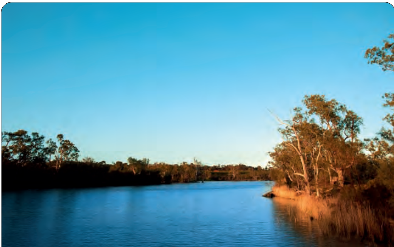
MURRAY - DARLING - Lunghezza: Km. 3750 - Nasce dalle Montagne Nevose (Alpi Australiane) e sfocia nell'Oceano Indiano Nel mondo: 14° per lunghezza - Paesi attraversati: Australia