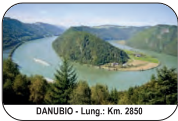
DANUBIO - Lung.: Km. 2850