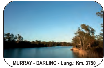
MURRAY - DARLING - Lung.: Km. 3750