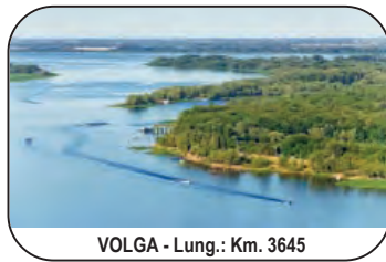
VOLGA - Lung.: Km. 3645