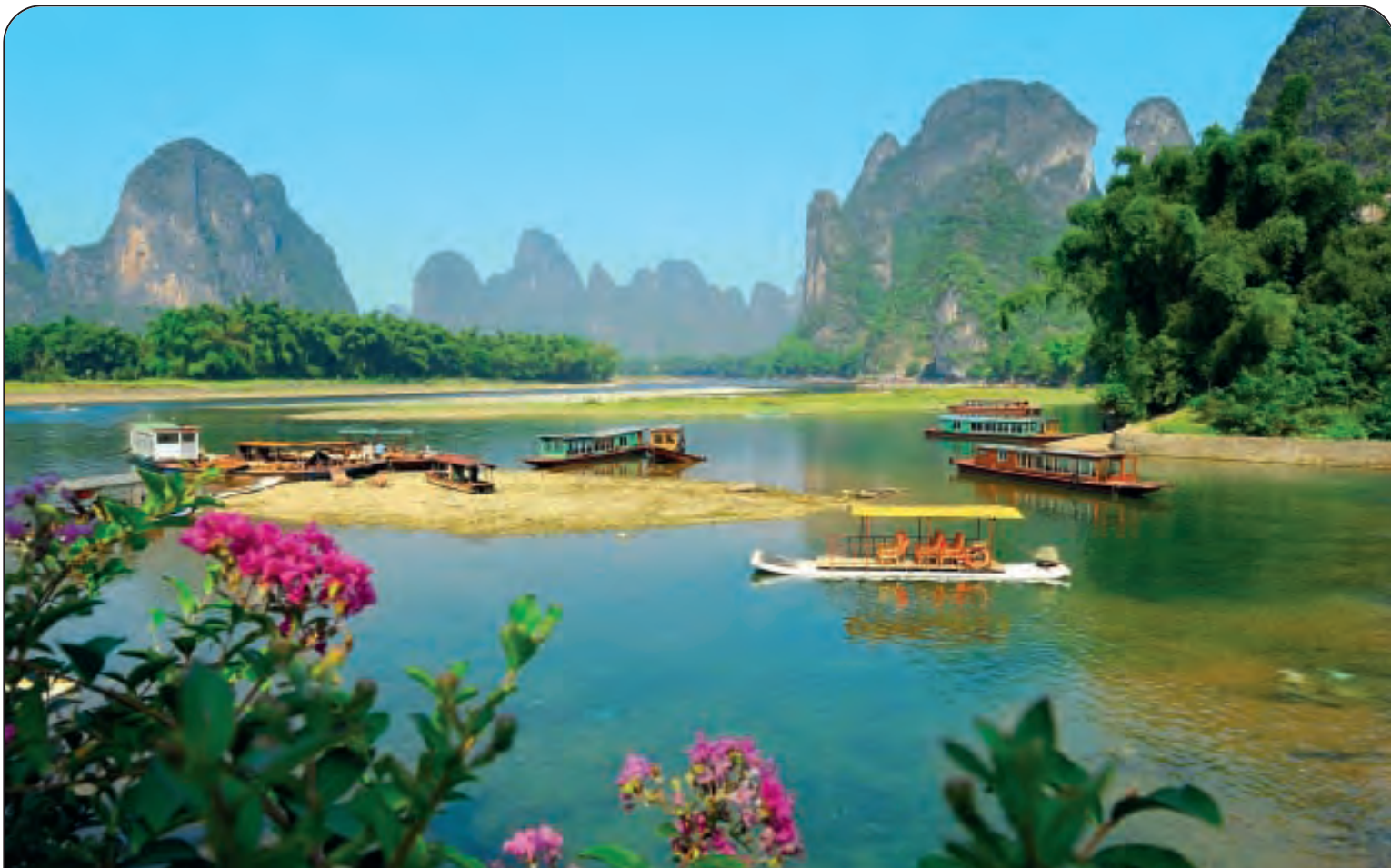
FIUME AZZURRO - Lunghezza: Km. 5797 - Nasce nel Qinghai (Cina) e sfocia nel Mar Cinese Orientale (Oceano Pacifico) Nel mondo: 4° per lunghezza - Paesi attraversati: Cina