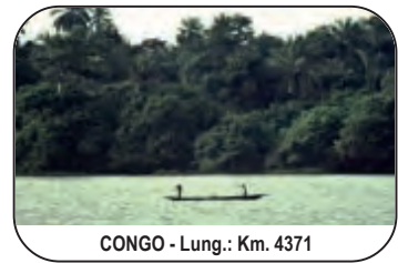
CONGO - Lung.: Km. 4371