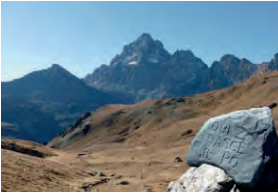
Sorgenti del Po: Monviso (mt. 3841)