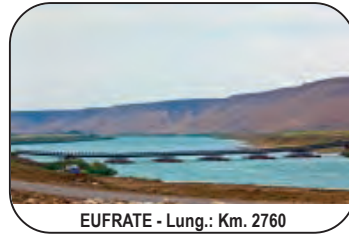
EUFRATE - Lung.: Km. 2760