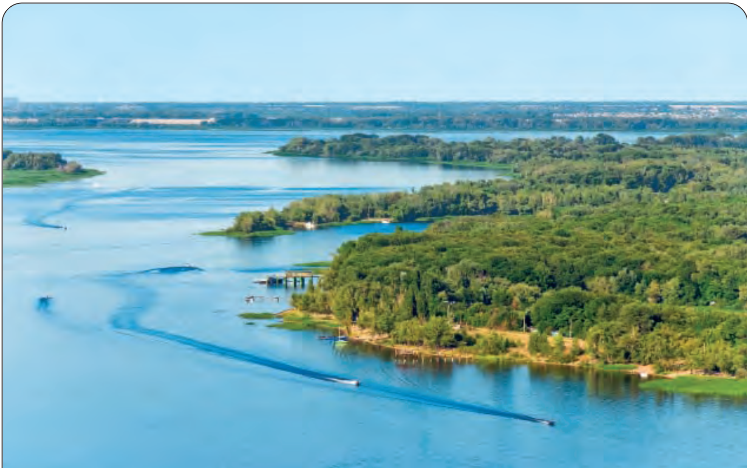
VOLGA - Lunghezza: Km. 3645 - Nasce nei Monti Valdaj (Russia) e sfocia nel Mar Caspio Nel mondo: 15° per lunghezza - Paesi attraversati: Russia