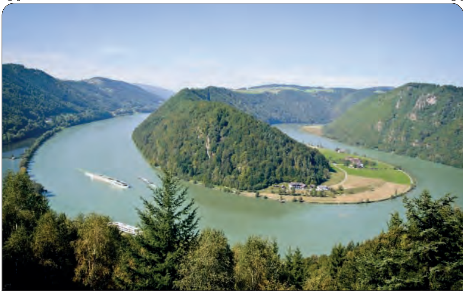
DANUBIO - Lunghezza: Km. 2850 - Nasce nella Foresta Nera (Germania) e sfocia nel Mar Nero Nel mondo: 28° per lunghezza - Paesi attraversati: Germania, Austria, Slovacchia Ungheria, Croazia, Serbia, Bulgaria, Romania, Moldavia, Ucraina