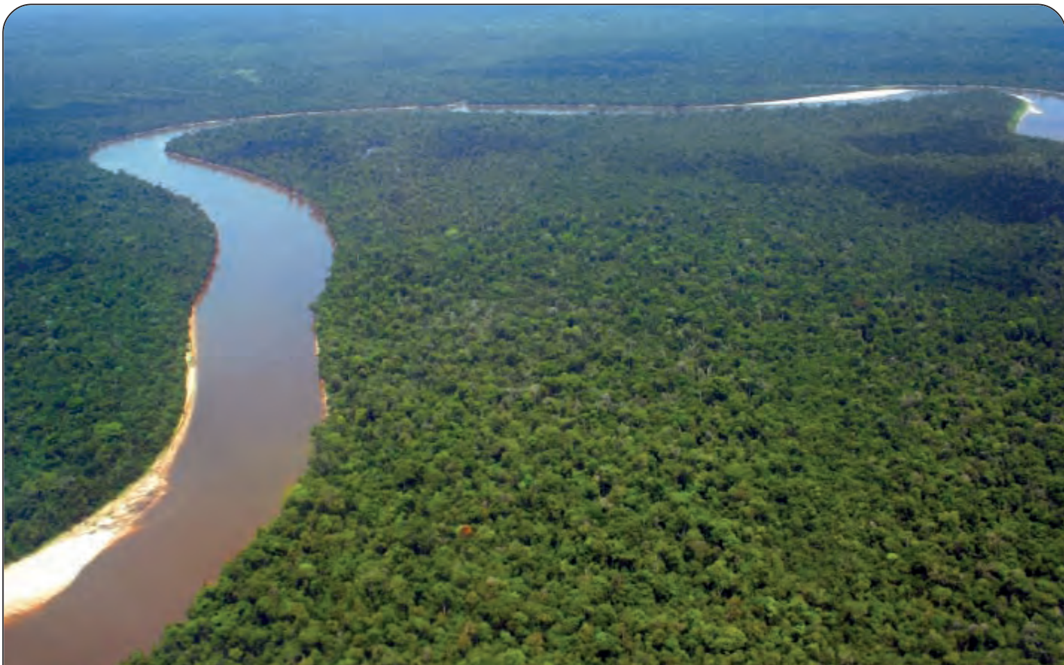
RIO DELLE AMAZZONI - Lunghezza: Km. 6973 - Nasce dai ghiacciai del Nevado Mismi (Perù) e sfocia nell'Oceano Atlantico Nel mondo: 1° per lunghezza - Paesi attraversati: Perù, Ecuador, Colombia, Venezuela, Bolivia, Brasile