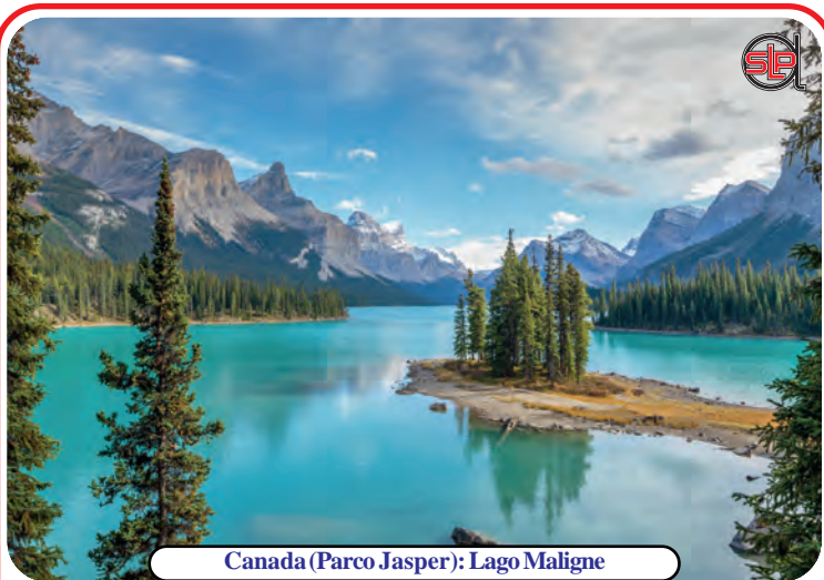
Canada (Parco Jasper): Lago Maligne