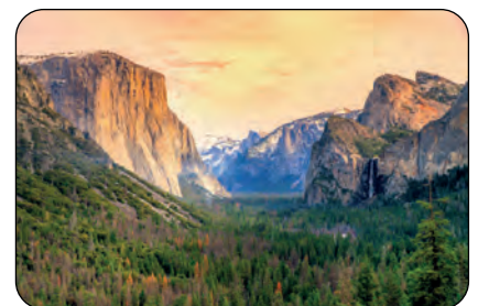
California (USA): Monte El Capitan Parco Yosemite