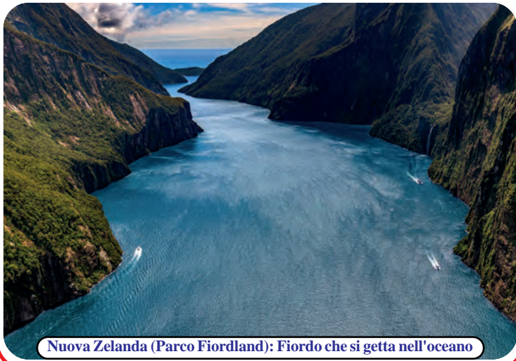
Nuova Zelanda (Parco Fiordland): Fiordo che si getta nell'oceano