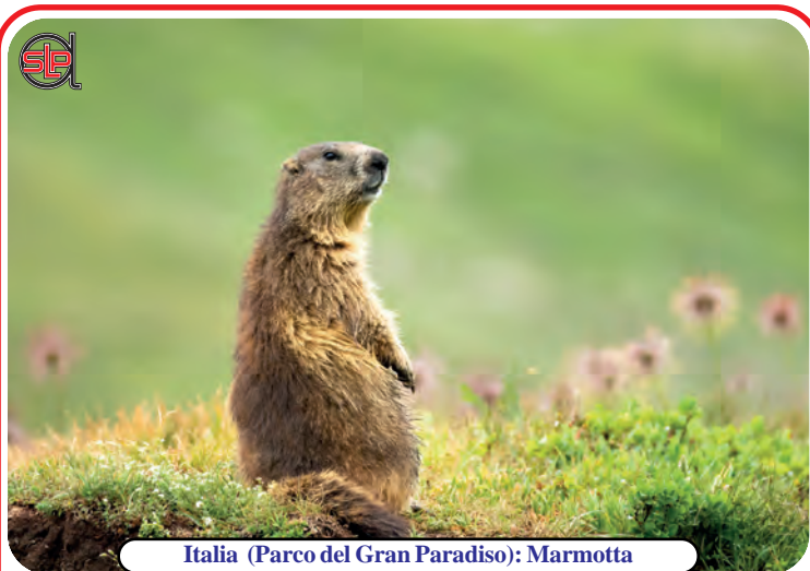
Italia (Parco del Gran Paradiso): Marmotta