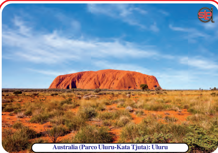
Australia (Parco Uluru-Kata Tjuta): Uluru