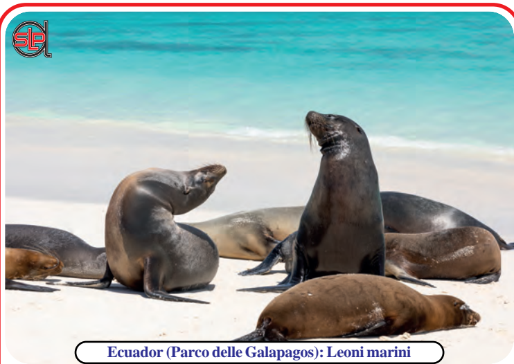
Ecuador (Parco delle Galapagos): Leoni marini