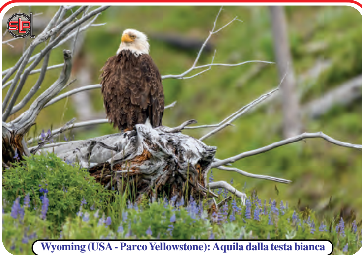
Wyoming (USA - Parco Yellowstone): Aquila dalla testa bianca