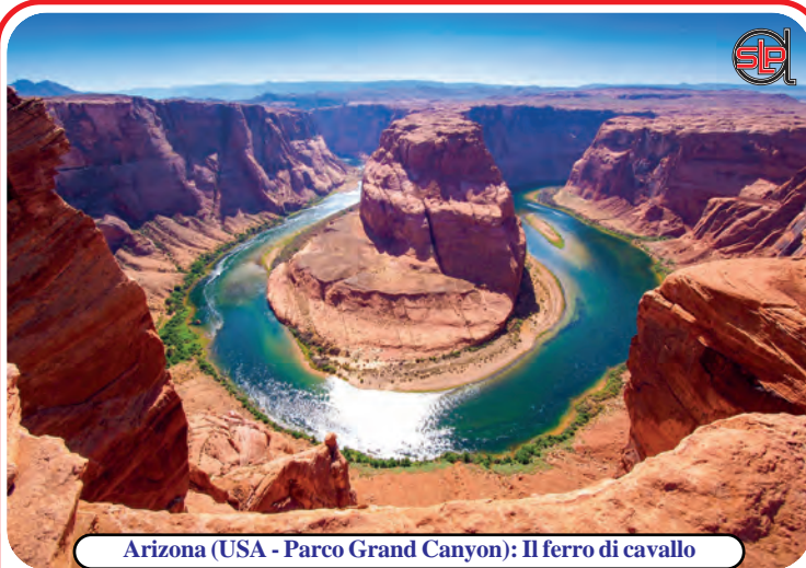
Arizona (USA - Parco Grand Canyon): Il ferro di cavallo