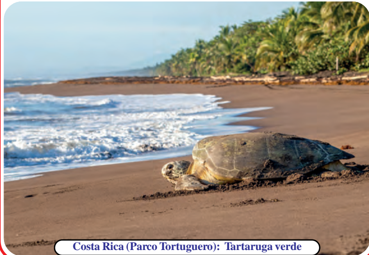
Costa Rica (Parco Tortuguero): Tartaruga verde