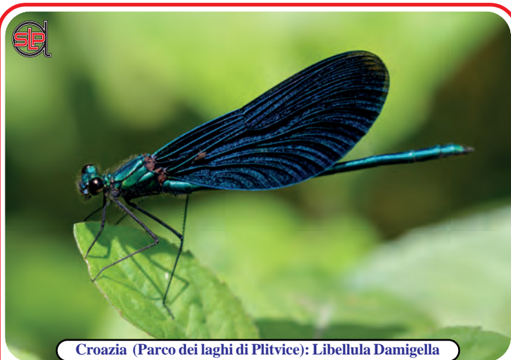
Croazia (Parco dei laghi di Plitvice): Libellula Damigella