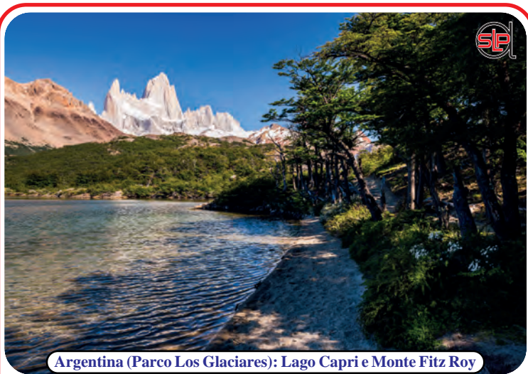
Argentina (Parco Los Glaciares): Lago Capri e Monte Fitz Roy