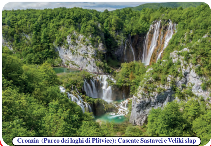
Croazia (Parco dei laghi di Plitvice): Cascate Sastavci e Veliki slap