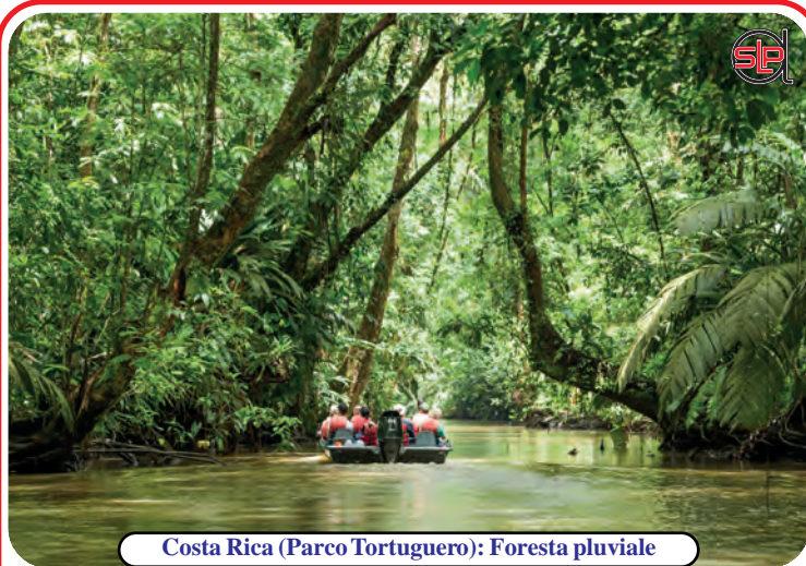
Costa Rica (Parco Tortuguero): Foresta pluviale