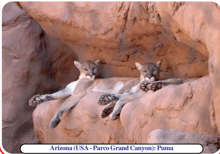
Arizona (USA - Parco Grand Canyon): Puma