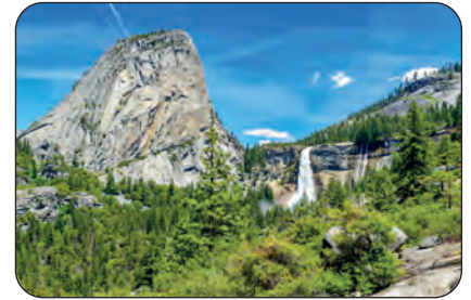
California (USA): Sentiero dedicato a John Muir Parco Yosemite

Fluisce la neve, rapida o lenta, nelle valanghe e nei ghiacciai creatori di bellezza; fluisce l’aria in maestose inondazioni che trasportano minerali e foglie, semi e spore, torrenti di musiche e di profumi; fluisce l’acqua trasportando rocce, in soluzione o in forma di fango, sabbia, ciottoli, sassi. Fluiscono le rocce dalla bocca dei vulcani, come acque dalle fonti e gli animali si raggruppano ed è tutto un fluire, un avanzare di zampe, di groppe in salto, d’ali spiegate, sulla terra, nell’aria, nel mare... E intanto le stelle corrono nello spazio spinte dal perenne pulsare, come globuli rossi nel caldo sangue della Natura.”