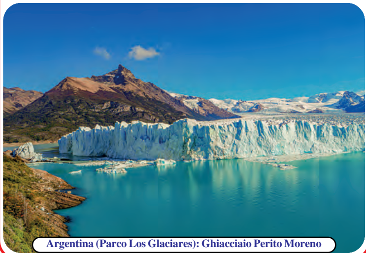
Argentina (Parco Los Glaciares): Ghiacciaio Perito Moreno