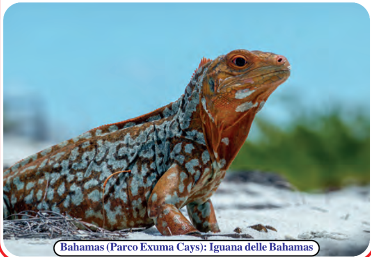
Bahamas (Parco Exuma Cays): Iguana delle Bahamas