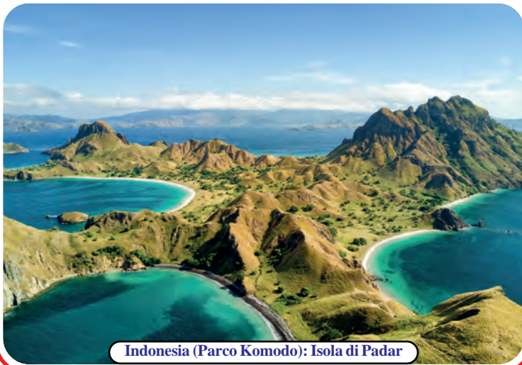
Indonesia (Parco Komodo): Isola di Padar