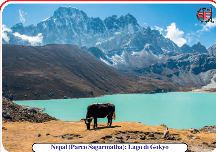
Nepal (Parco Sagarmatha): Lago di Gokyo