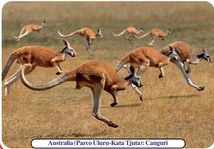
Australia (Parco Uluru-Kata Tjuta): Canguri