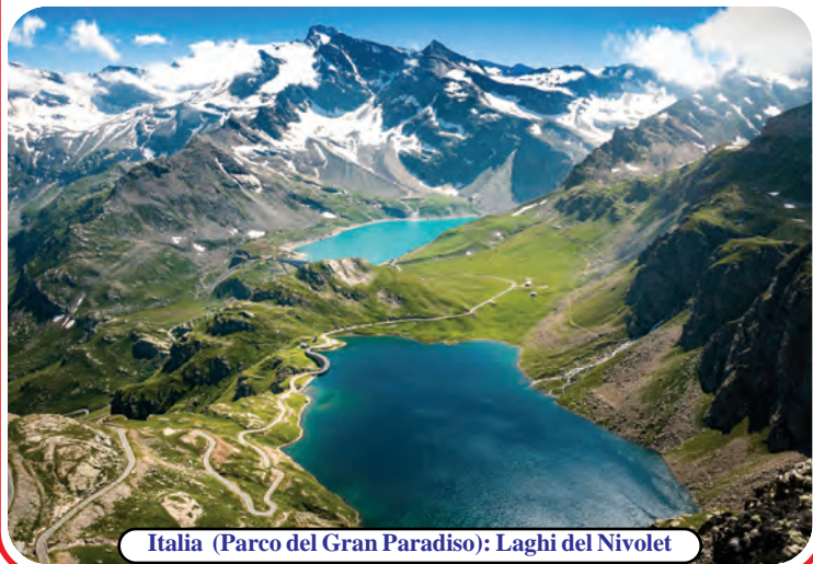
Italia (Parco del Gran Paradiso): Laghi del Nivolet