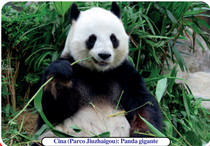
Cina (Parco Jiuzhaigou): Panda gigante