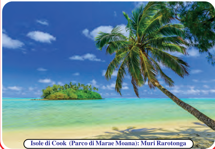
Isole di Cook (Parco di Marae Moana): Muri Rarotonga