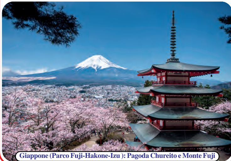
Giappone (Parco Fuji-Hakone-Izu): Pagoda Chureito e Monte Fuji