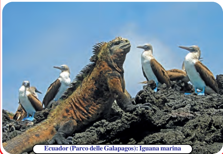
Ecuador (Parco delle Galapagos): Iguana marina