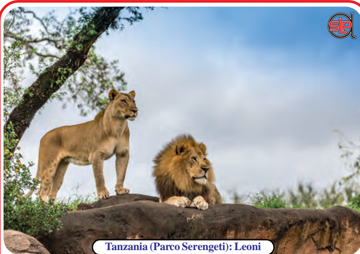
Tanzania (Parco Serengeti): Leoni