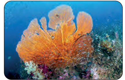
Australia: Corallo Gorgonia Parco della Grande Barriera Corallina

La storia delle aree protette inizia ufficialmente nel 1872, quando viene fondato il primo parco nazionale al mondo, lo Yellowstone, negli Stati Uniti. Se prima di questa data le aree naturali venivano salvaguardate per scopi religiosi, politico-economici, o per privilegi personali, quali la caccia, con l’istituzione dello Yellowstone si fa strada il concetto per il quale John Muir si è tanto adoperato: la conservazione, invece che la distruzione, della natura, “per il beneficio e la gioia della gente”, come dice l’iscrizione situata all’entrata del parco, e non di pochi privilegiati. Gli elementi naturali assumono la stessa importanza dei monumenti: sono una ricchezza da custodire e proteggere per il bene dell’umanità.