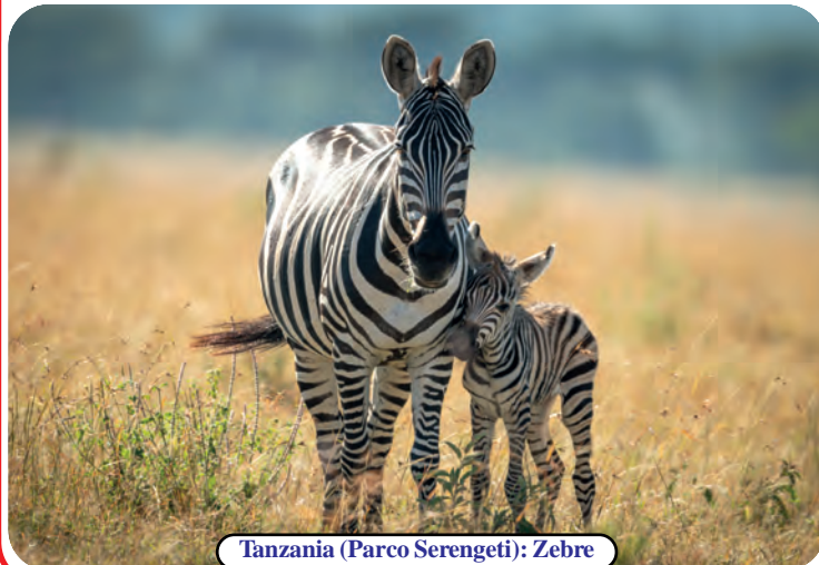
Tanzania (Parco Serengeti): Zebre