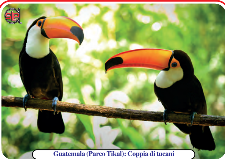
Guatemala (Parco Tikal): Coppia di tucani