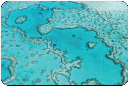
Australia: Barriera Corallina - Heart Reef Parco della Grande Barriera Corallina

Responsabile delle più grandi azioni svolte per la creazione dei parchi Sequoia e Yosemite, nel 1892 fonda il Sierra Club, la più antica e grande organizzazione per la difesa dell’ambiente degli Stati Uniti e ne diviene il primo presidente; nel 1903 fa la storia con il suo viaggio in campeggio in compagnia di Theodore Roosevelt, riuscendo con i suoi racconti minuziosi sulla natura ad affascinare il presidente a tal punto che, tre anni più tardi, viene firmata la legge a protezione della valle dello Yosemite, legge che dà origine alle politiche ambientaliste del futuro.