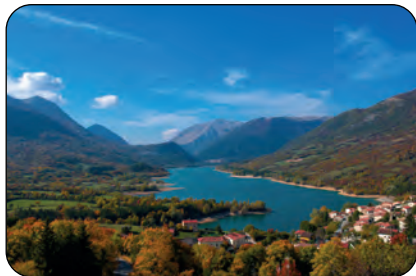
Italia: Lago Barrea Parco d’Abruzzo Lazio e Molise

L’esempio americano viene ben presto seguito da molti altri paesi in tutto il mondo: l’Australia nel 1879, il Canada nel 1885 e la Nuova Zelanda nel 1887, tutti paesi con grandi territori di proprietà pubblica, in aree poco accessibili e quasi del tutto disabitate.