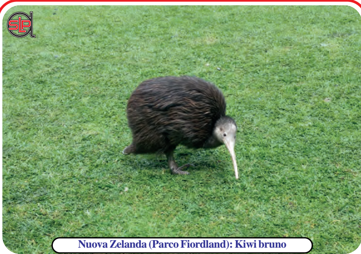
Nuova Zelanda (Parco Fiordland): Kiwi bruno