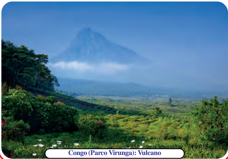
Congo (Parco Virunga): Vulcano