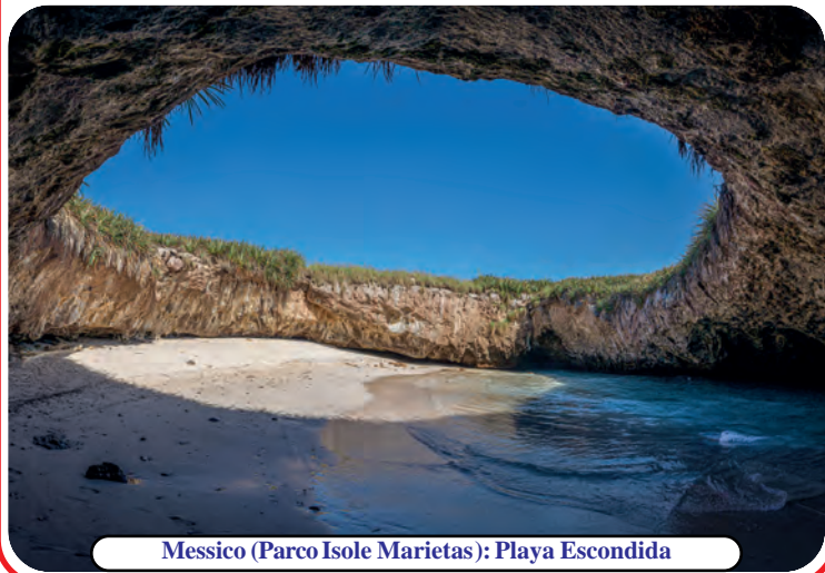
Messico (Parco Isole Marietas): Playa Escondida