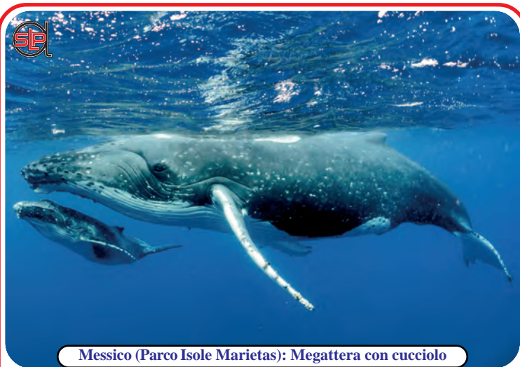
Messico (Parco Isole Marietas): Megattera con cucciolo