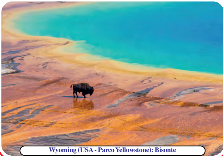
Wyoming (USA - Parco Yellowstone): Bisonte