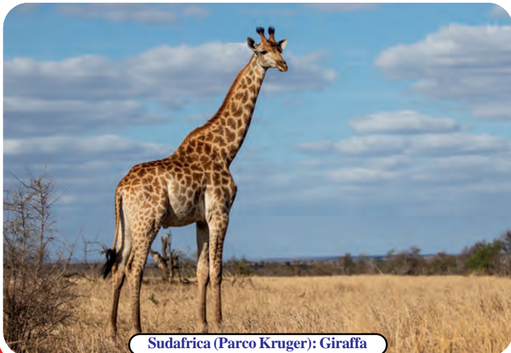
Sudafrica (Parco Kruger): Giraffa