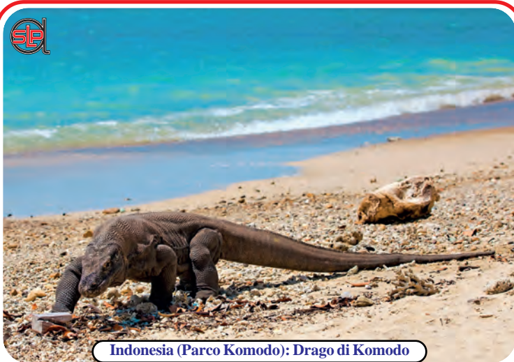
Indonesia (Parco Komodo): Drago di Komodo