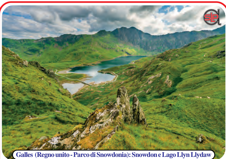
Galles (Regno Unito - Parco di Snowdonia): Snowdon e Lago Llyn Llydaw