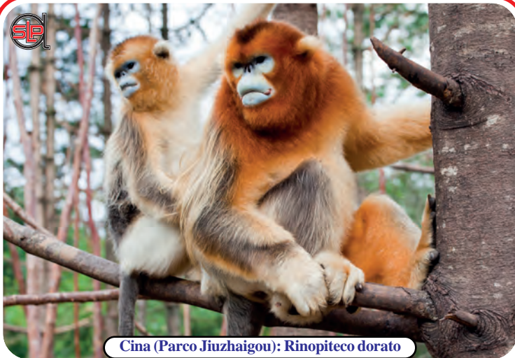
Cina (Parco Jiuzhaigou): Rinopiteco dorato