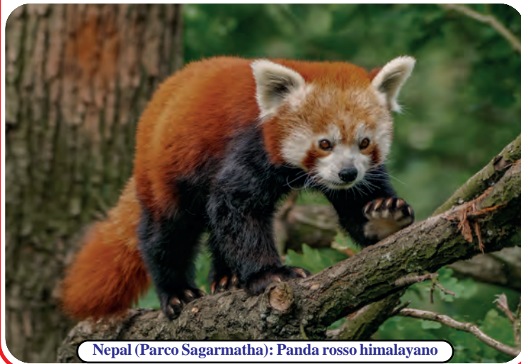
Nepal (Parco Sagarmatha): Panda rosso himalayano