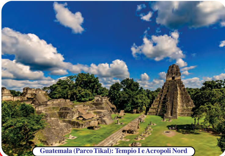
Guatemala (Parco Tikal): Tempio I e Acropoli Nord