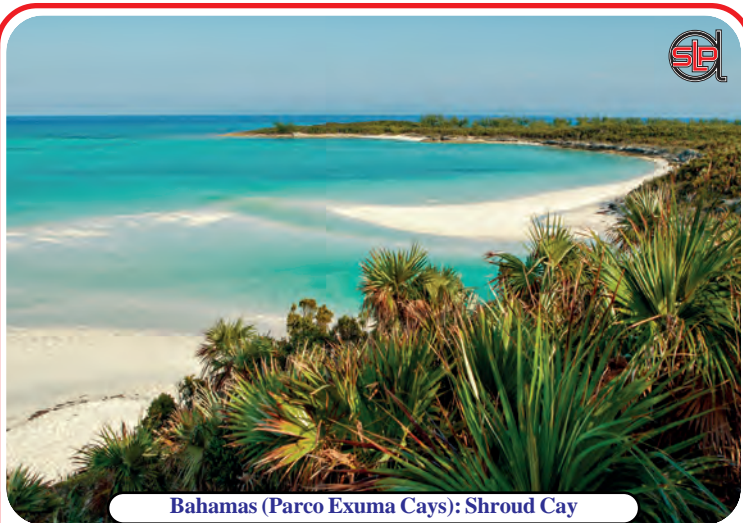
Bahamas (Parco Exuma Cays): Shroud Cay