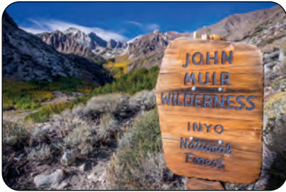
California (USA): Foresta John Muir Wilderness Foresta Inyo Sierra

“Contemplando il rivestimento di merletto che i torrenti disegnano sulle montagne non si può non rammentare che ogni cosa fluisce, ogni cosa si muove verso un qualche punto, gli esseri viventi e le rocce così dette inanimate come l’acqua.