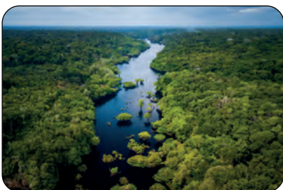
Brasile: Foresta amazzonica Parco Anavilhanas

“La Terra è un bel posto e vale la pena lottare per lei”.