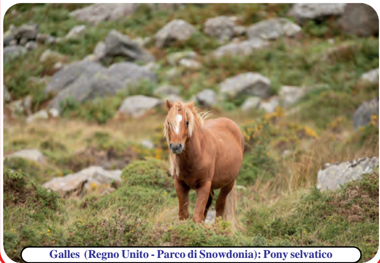
Galles (Regno Unito - Parco di Snowdonia): Pony selvatico