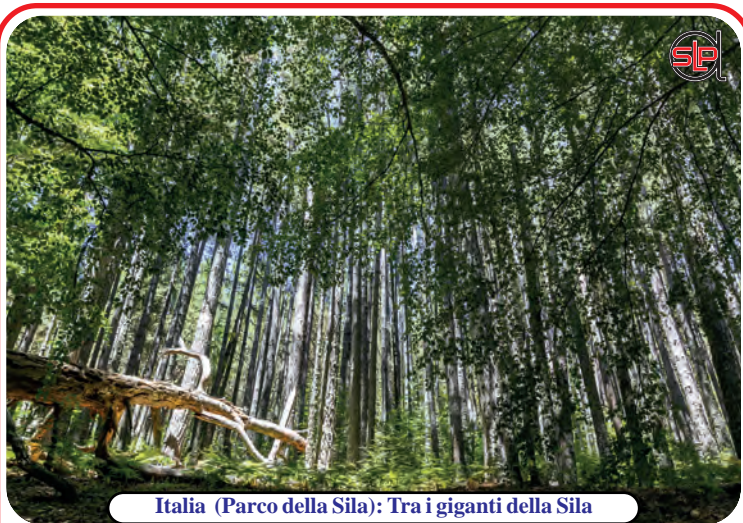
Italia (Parco della Sila): Tra i giganti della Sila