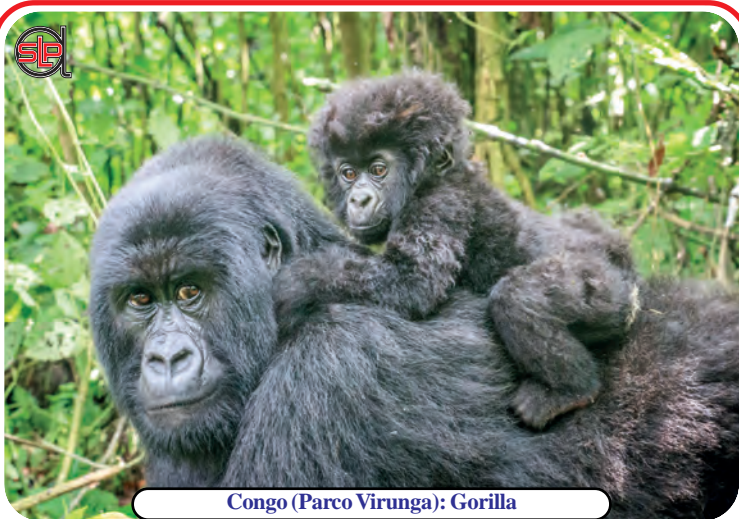
Congo (Parco Virunga): Gorilla