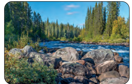
Svezia: Vicinanze Lago Tjaktjajavrre Parco Sarek

In Italia i primi abbozzi di discussione parlamentare sulla conservazione della natura si devono all’azione dei due deputati Luigi Rava e Giovanni Rosadi, i quali presentarono una serie di progetti di legge: in questi atti si fa strada una visione che contrappone la difesa ambientale allo sfruttamento economico