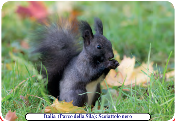
Italia (Parco della Sila): Scoiattolo nero