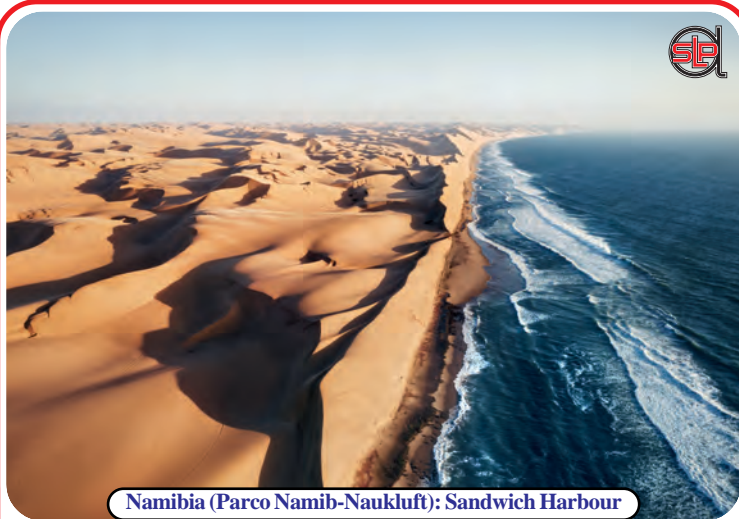
Namibia (Parco Namib-Naukluft): Sandwich Harbour