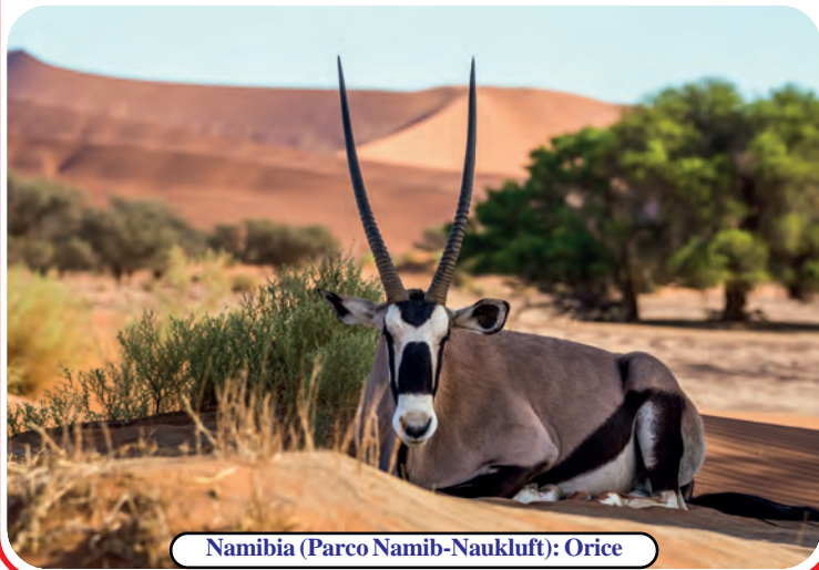
Namibia (Parco Namib-Naukluft): Orice