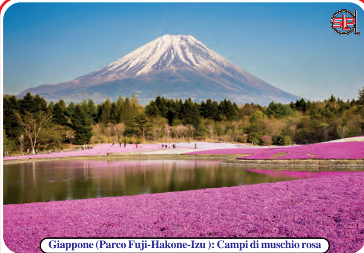
Giappone (Parco Fuji-Hakone-Izu): Campi di muschio rosa