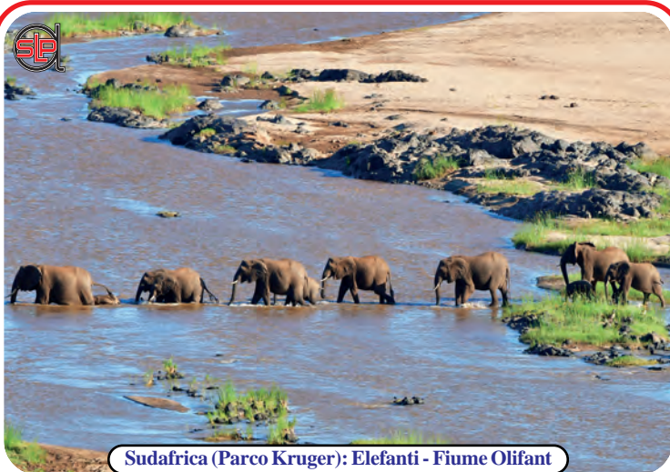
Sudafrica (Parco Kruger): Elefanti - Fiume Olifant